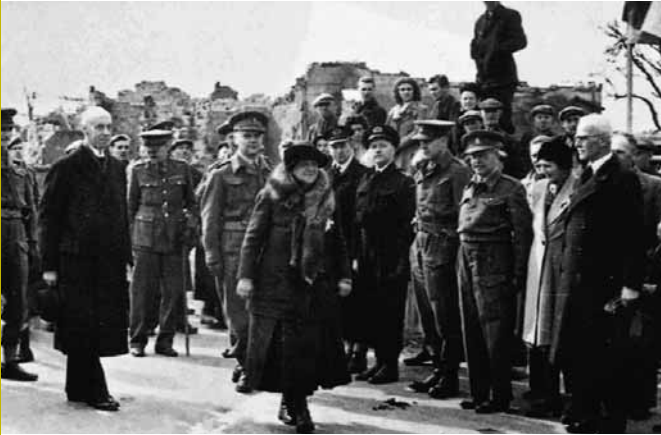
Koningin Wilhelmina keert terug naar Nederland.