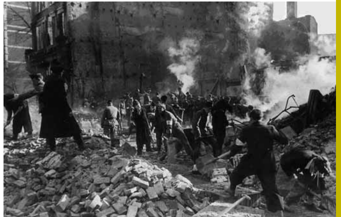
De stad Nijmegen gebombardeerd.