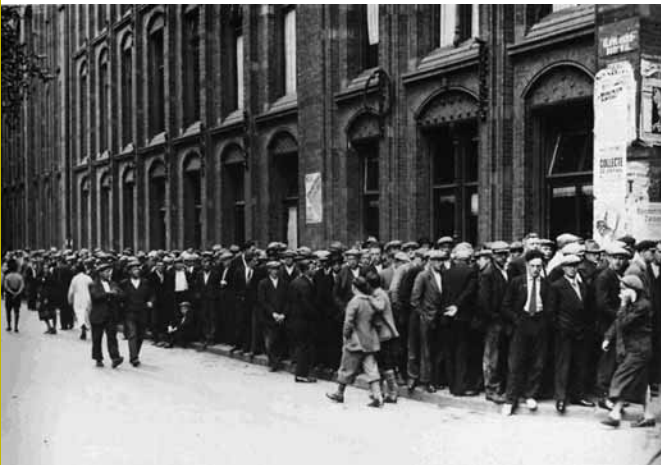
Werklozen in de rij om te stempelen.