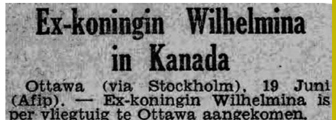
Een krantenbericht van 19 juni 1942.