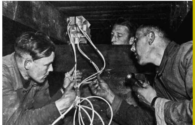
Een knokploeg bereidt een bomaanslag voor in de strijd tegen de Duitse overheersing.