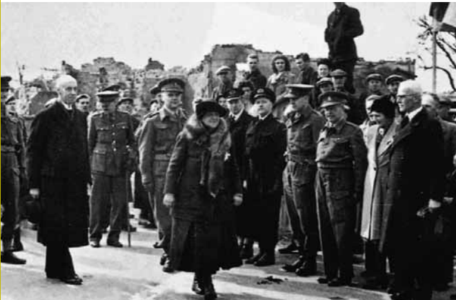
Koningin Wilhelmina keert terug naar Nederland.