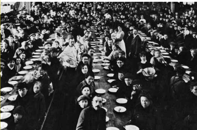
De opvang van Belgische vluchtelingen in het neutrale Nederland.